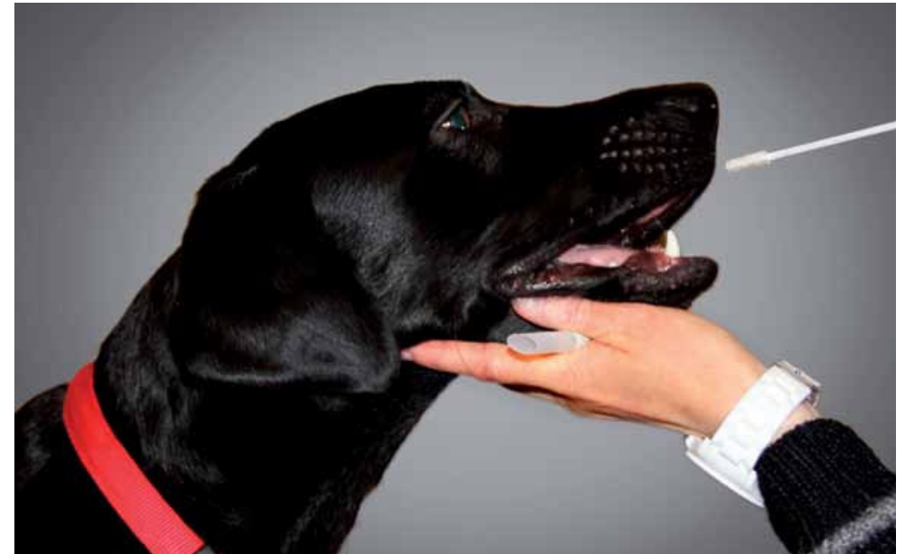
CSI TIERplus: Entnahme von genetischem Probematerial

Unsere vierbeinigen Begleiter sind uns ans Herz gewachsen. Längst nicht mehr teilen wir mit ihnen nur Haus, Couch und Essen. Mensch und Hund haben mehr gemeinsam, als uns manchmal lieb ist, und dazu gehören auch genetische Erkrankungen.